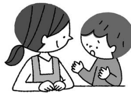
なや 悩みがあるとき そうだん 相談できる