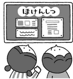
けんこう 健康について し 知りたいとき