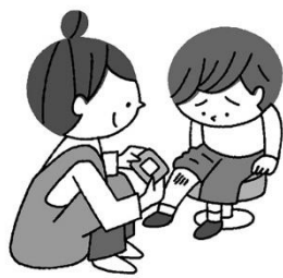
ケガをしたとき きゅうきゅうしよち 救急処置してもらえます