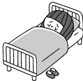
ぐあい わる 具合が悪いとき いちじてき きゅうよう 一時的に休養できる