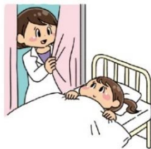
体調が悪いときに休む