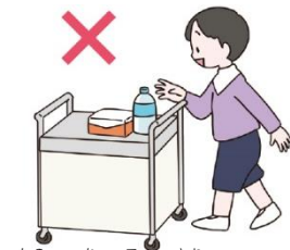
物を勝手に触らない