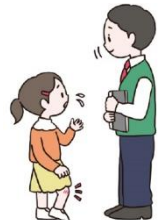
先生と一緒に来る (先生に伝えてから来る)