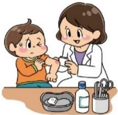
けがの手当てをする