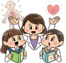
からだやこころについて知る